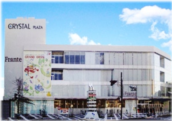
クリスタルプラザ多治見

建物の向かって右手に駐車場入口があります。その隣のガラス扉から館内に入り、ATM奥にあるエレベーターで4階までお上がりください。